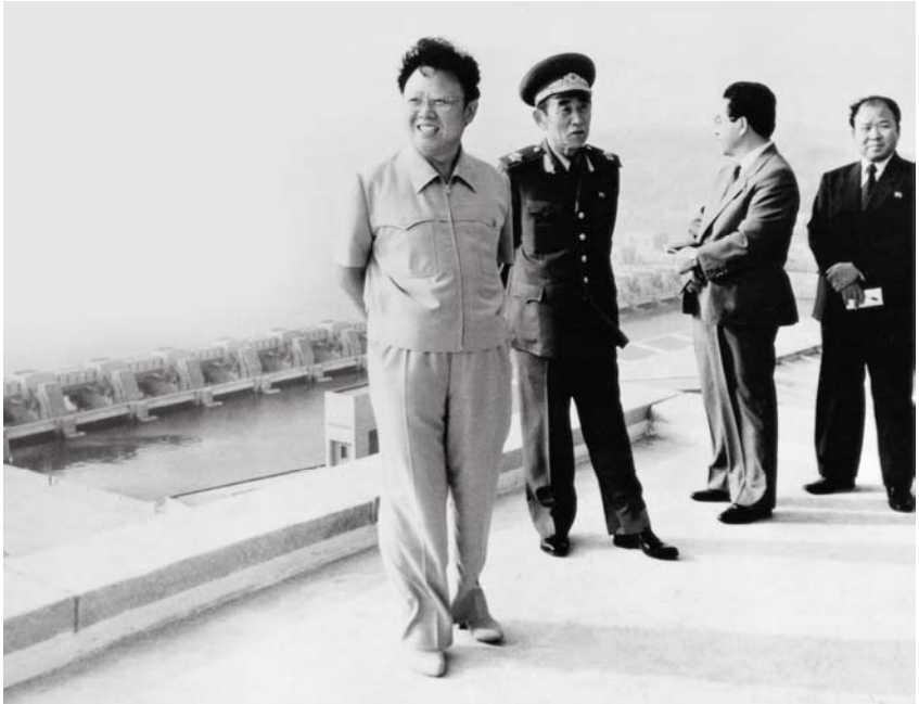
Bei der Vor-Ort-Anleitung am Westmeerschleusenkomplex (23. Juni 1986)