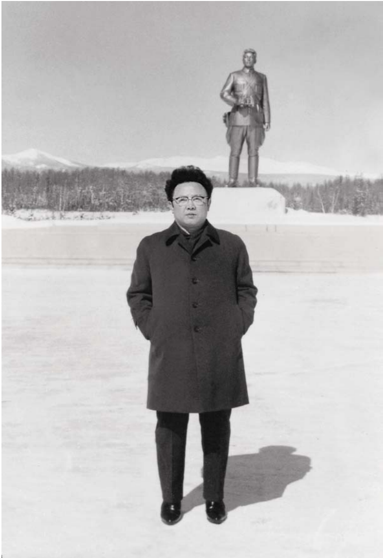
Beim Großmonument Samjiyon (22. März 1979)